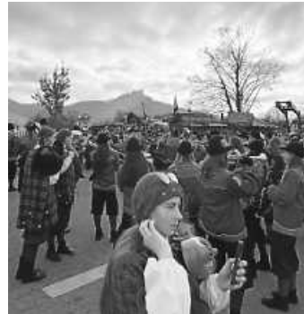
Im Schatten der Burg rockten wir das närrische Volk.