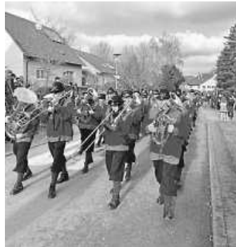
Beim Umzug in Stetten gaben wir ein tolles Bild ab.