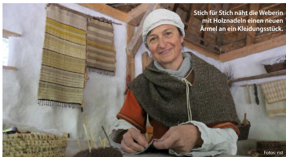
Stich für Stich näht die Weberin mit Holznadeln einen neuen Ärmel an ein Kleidungsstück.