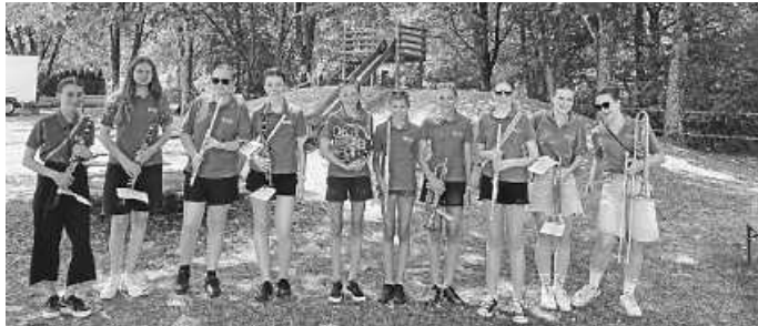
Unsere Jugendkapelle hat uns unterstützt.

Terminvorschau: Am Freitag, dem 31.07.2026, um 19 Uhr gestalten wir unseren Sommerabschluss bei der Kirche.