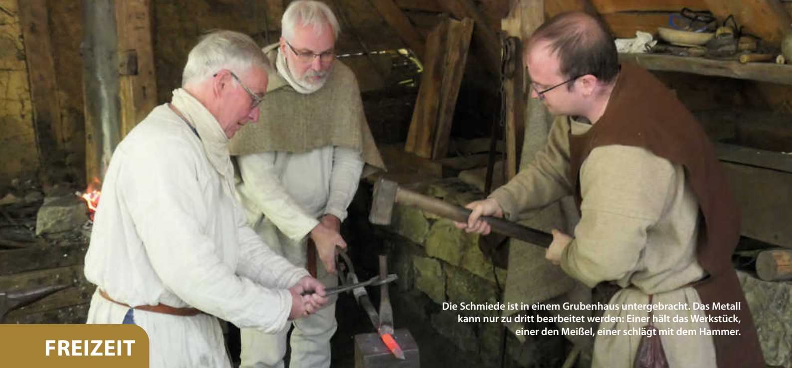
Die Schmiede ist in einem Grubenhaus untergebracht. Das Metall kann nur zu dritt bearbeitet werden: Einer hält das Werkstück, einer den Meißel, einer schlägt mit dem Hammer.