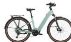
BERGAMONT E-HORIZON SPORT 20

Viele weitere Angebote* von HERCULES und ORBEA