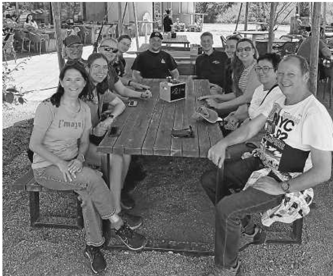
Team 1 bei einer kleinen Einkehr zwischendurch ...