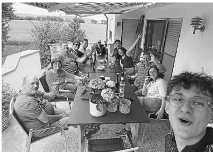
Auch Team zwei gönnte sich eine Pause