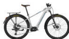
MONDRAKER PRIME X eBike