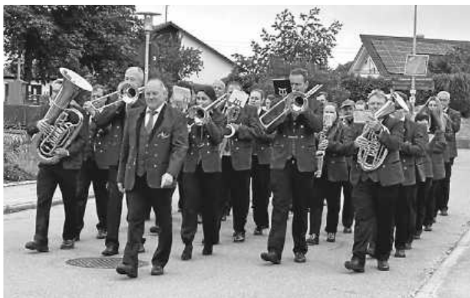
Der Musikverein Dormettingen unter der Leitung von Musikdirektor Thomas Michelfeit.