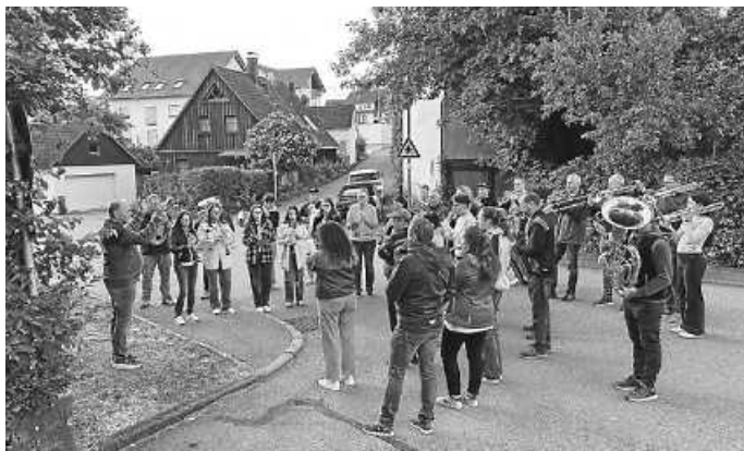
Mit der Tagwache begrüßten wir den Tag des Herrn

Liebe Musikfreunde, auch in diesem Jahr durften wir das Fronleichnamfest in unserer Gemeinde mitgestalten. Pünktlich morgens um 5 Uhr die Tagwache, mit der der Tag des Herrn feierlich eröffnet wird. Nach dem Gottesdienst haben wir dann die Prozession zu den wunderschönen Altären angeführt. Nach dem Segen haben wir dann noch mit flotten Märschen vor der Kirche aufgespielt, be- vor wir zum geselligen Teil übergegangen sind. Immer wieder ein schöner Anlass um sich auszutauschen und das Gemeindeleben zu genießen. Hoffen wir, dass es uns auch in den nächsten Jahren vergönnt ist. Gruß Euer Musikverein Dormettingen e.V.