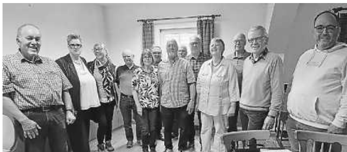
Das Bild zeigt die Vorstandschaft und die Mitglieder die geehrt wurden

Nach einer kurzen Pause folgte der Vortrag zum Schwerbehindertenrecht und zur Erwerbsminderungsrente durch Rechtsanwalt Michael Ashcroft. Die Zuhörer bekamen dabei auf kurzweilige Art viele Informationen und Wissenswertes zu den Themen vermittelt.