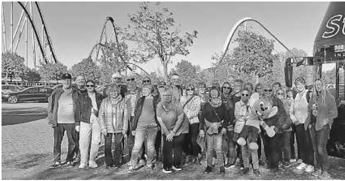
Das Bild zeigt die Teilnehmer vor dem Europa-Park