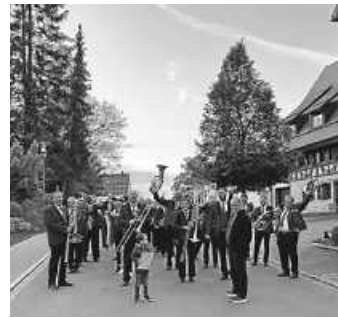
In Dormettingen angekommen war der Jubel immer noch groß, bevor wir zur Kirche marschierten