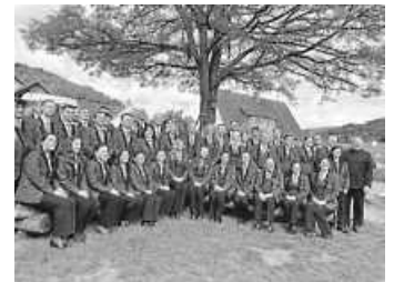
Der Musikverein Dormettingen nach seinem Vortrag.