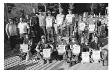
Die teilnehmenden Auszubildenden am Berufswettbewerb in der Sparte Garten- und Landschaftsbau.

Zum Eröffnungstag am 24.04.2026 war die SVLFG wieder mit einem Infostand am „Treffpunkt Grün“ des Verbandes Garten-, Landschafts- und Sportplatzbau Baden-Württemberg vertreten. Sie machte dabei nicht nur die Besucherinnen und Besucher, sondern vor allem auch die jungen Wettkämpfer auf den wichtigen Sonnen- und Hitzeschutz bei der Arbeit im Freien aufmerksam.