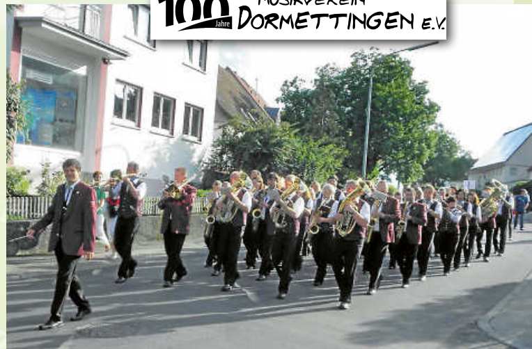
Der hervorragende Musikverein Dormettingen nach dem Wertungsspiel in Rangendingen im Jahr 2011.