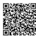
Video Doku Togo

Oder scannen Sie den oberen QR Code auf der rechten Seite.