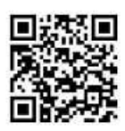
Kontakt zum Projekt