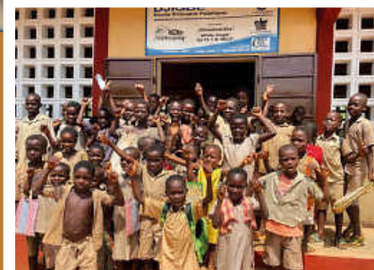
> White Angel for Fly and Help Nürnbergring Schule in Djigbe.

Für mehr Infos zu den Projekten oder um uns via PayPal/Überweisung direkt zu unterstützen , scannen Sie den QR-Code.