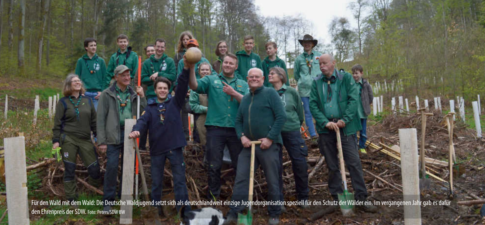
Für den Wald mit dem Wald: Die Deutsche Waldjugend setzt sich als deutschlandweit einzige Jugendorganisation speziell für den Schutz der Wälder ein. Im vergangenen Jahr gab es dafür den Ehrenpreis der SDW.