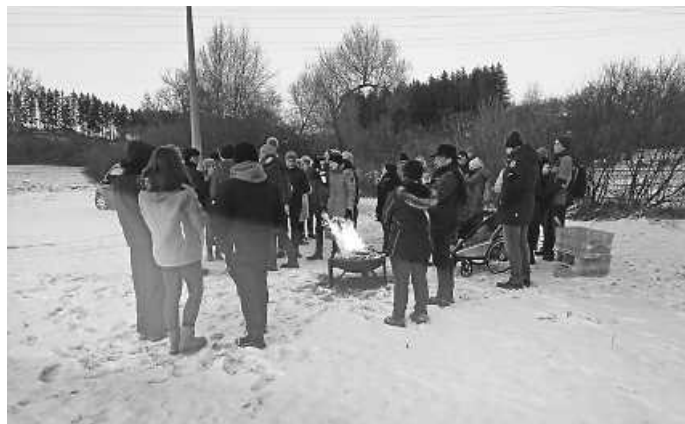
Bei einem Zwischenstop gabs Glühwein und Brettle.