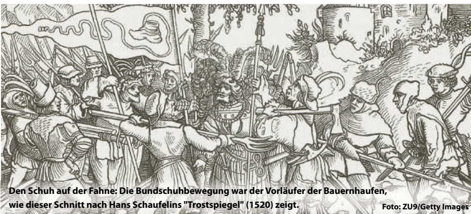
Den Schuh auf der Fahne: Die Bundschuhbewegung war der Vorläufer der Bauernhaufen, wie dieser Schnitt nach Hans Schaufelins "Trostspegel" (1520) zeigt.

In Baden-Württemberg werden den aufständischen Bauern dieses Jahr etliche Veranstaltungen und Ausstellungen gewidmet. So hat das Landesmuseum Württemberg gleich mehrere große Projekte auf den Weg gebracht: Von der Erlebnisausstellung „Protest!“ in Stuttgart über spektakuläre KI-Projekte („Uffruhr!“) in Bad Schussenried, die auch mobil unterwegs ist oder einer Kinderausstellung („Zoff!“). Doch auch an den historischen Stätten im Kraichgau, Heilbronn oder Böblingen ist zum 500. Jahrestag der Aufstände einiges an Programm geboten. (js)