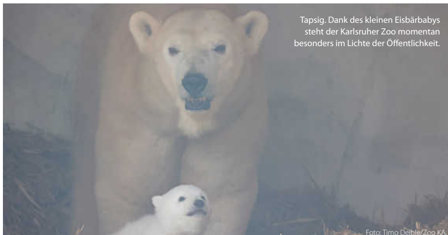
Tapsig. Dank des kleinen Eisbärbabys steht der Karlsruher Zoo momentan besonders im Lichte der Öffentlichkeit.

Apropos Artenschutz. Das Thema ist Reinschmidts wichtigste Antriebsfeder. Seit er die Leitung des Zoos vor sieben Jahren übernommen hat, ist viel passiert: „Wenn der Zoo wie vor 40 Jahren wäre, würde ich mich für die Schließung einsetzen.“ Diese Zeiten der Tierhaltung seien überholt. Sein Ziel: den klassischen Zoo in ein modernes Artenschutzzentrum umbauen. (tam)