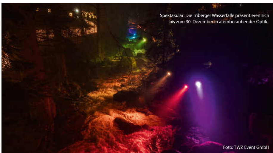
Spektakulär: Die Tribberger Wasserfälle präsentieren sich bis zum 30. Dezember in atemberaubender Optik.