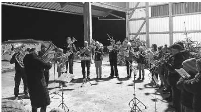
Unsere Jugendkapelle spielte weihnachtliche Weisen.

Liebe Musikfreunde, herzlichen Dank für Euren zahlreichen Besuch beim ersten Adventszauber auf dem Lindenhof. Der Christbaumverkauf ist in diesem Rahmen sehr gut angekommen und bis auf eine Handvoll Bäume haben alle einen Abnehmer gefunden. Hier ein herzliches Dankeschön an Familie Steimle, die für uns Ihre Halle ausgeräumt und zur Verfügung gestellt haben. Das Rahmenprogramm mit musikalischer Unterhaltung, heißen Getränken und leckeren Snacks wurde sehr gut angenommen. Auch die stimmungsvolle Dekoration und die liebevoll gestalteten Stände der Marktanbieter trugen zu einer weihnachtlichen Atmosphäre bei. Somit eine rundum gelungene Veranstaltung, bei der viele Dormettinger zusammen geholfen und ein tolles Event geschaffen haben. Von allen Dormettinger Vereinen war Equipment im Einsatz, das ist ein schönes Zeichen für die gute Zusammenarbeit miteinander. Vielen Dank allen Helfern, begonnen bei der Auswahl der Bäume, die wir in der Christbaumkultur selbst aussuchen durften. Für den Aufbau der Stände und Infrastruktur, die Bewirtung der Gäste und schließlich der Abbau. Unseren Blockflöten-Kids und der Jugendkapelle mit Ihren Betreuern für die gelungenen Auftritte und Ihren Einsatz ein herzliches Dankeschön! Euer Musikverein Dormettingen e. V.