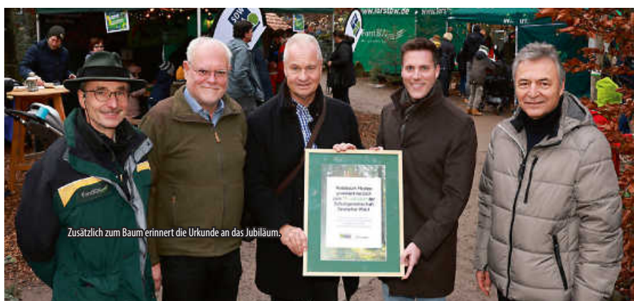
Zusätzlich zum Baum erinnert die Urkunde an das Jubiläum.

Mit der Elsbeere hat man für die Pflanzung einen klimaresistenten, heimischen Laubbaum gewählt, der sich sehr gut für trockene bis sehr trockene Standorte in warmen Regionen eignet. Elsbeeren können zwischen 20 und 30 Meter hoch werden und sind aufgrund ihrer Eigenschaften ideal für den Waldbau im Klimawandel. Weil Nadelwälder aufgrund der globalen Erwärmung stark geschädigt sind und keine gute Zukunft haben, sollen sie durch laubholzreiche Mischwälder ersetzt werden. Neben Traubeneichen, Hainbuchen und Linden werden deshalb auch Elsbeeren gepflanzt, die bestens an das künftige Klima angepasst sind. (dyh)