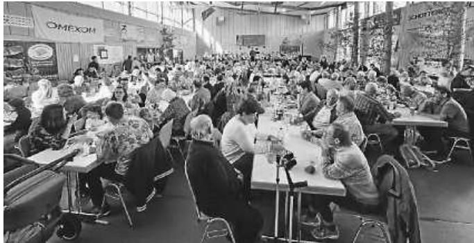
Unsere beliebte Schlachtplatte kam wieder gut an!