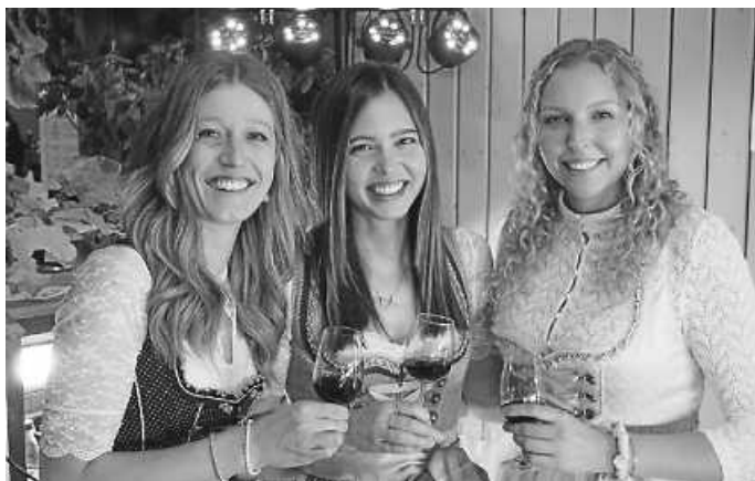
Unser Team von der Weinbar