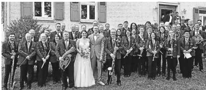
Das Brautpaar mit ihren Musikkameraden.