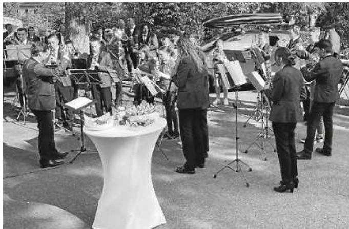
Unsere Jugendkapelle überraschte ihre Dirigentin mit einem Ständchen.