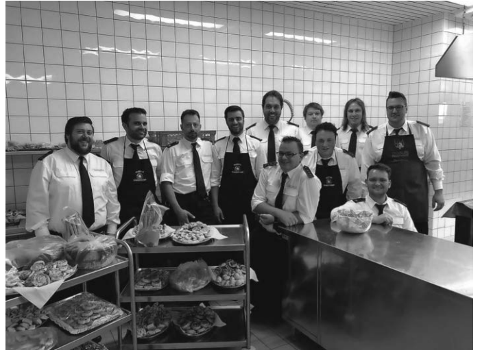
Das Team der Feuerwehr hat ein super Job gemacht !

Herzlichen Dank nochmal für Euer Kommen und wir hoffen Ihr habt den Abend ebenso genossen wie wir vom Musikverein. Euer 100jähriger Musikverein Dormettingen e.V.