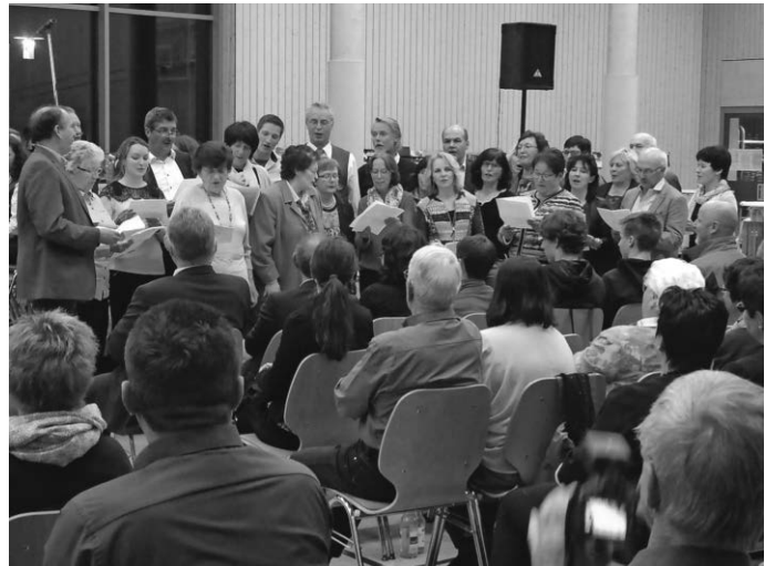
Der Kirchenchor überraschte uns mit einem Ständchen !