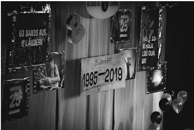
25 Jahre Balingen Rockfestival

O Herr, mit ist bange! Tritt als Bürge für mich ein! Jesaja 38,14