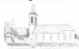
St. Matthäus Dormettingen