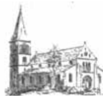
St. Martinus Dotternhausen