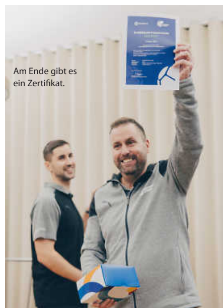
Am Ende gibt es ein Zertifikat.

Und weil laut einer alten Trainerweisheit nach dem Spiel vor dem Spiel ist: Die nächste Runde steht aktuell in den Startlöchern und verspricht erneut eine intensive Auseinandersetzung mit relevanten pädagogischen Themen im Sport. Bewerben können sich Trainerinnen und Trainer aus dem Gebiet der Nussbaum Medien. Es gilt allerdings, schnell zu sein, denn die Bewerbungsphase läuft noch bis zum 4. Februar. (red)