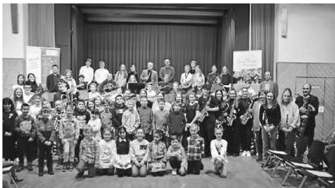
Alle Jungmusikerinnen und Jungmusiker, die beim Jahreskonzert der Jugendmusikschule Zollernalb in der CircuitBox gespielt haben.